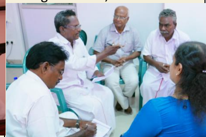
et services sociaux de l'enfance