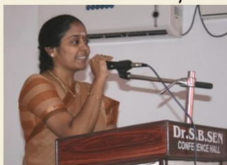
Add. Government pleader