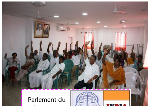
Parlement du bon sens 2016

Un an après : Quel bilan, quelles préconisations?