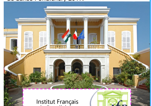
Institut Français de Pondichéry

Au programme: restitution des travaux du Parlement du bon sens 2016, chants carnatics, percussions et danses par les lauréats de la compétition de danse Pondichéry 2017.